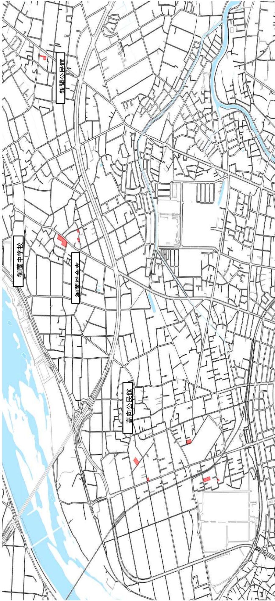
御園地区 平成31年度 賦課対象区域