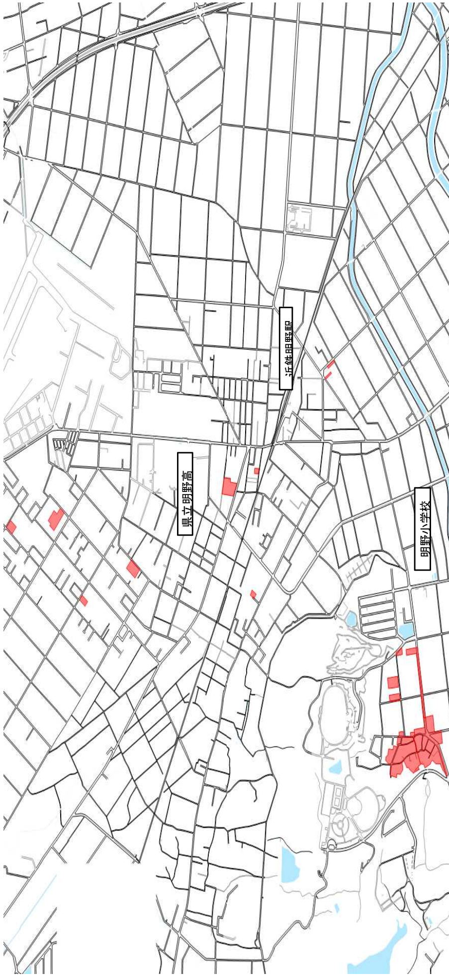
小俣地区 ■ 平成31年度 賦課対象区域